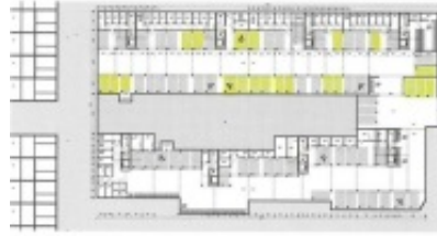
ARHITEKTURA: DR. DR. ZVELEPPROJEKCIJE - DR. NIJK